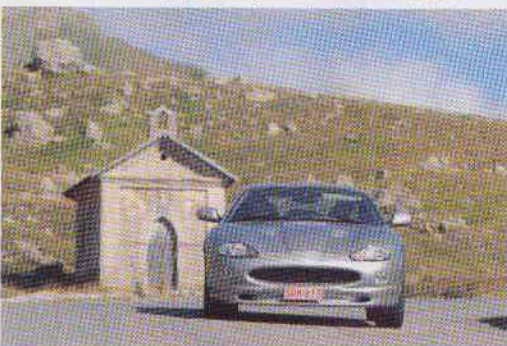
Cette Jaguar moderne a été exceptionnellement admise au départ