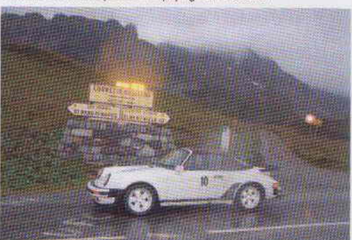
Côté météo, tout avait mal commencé avec une première journée exécration...