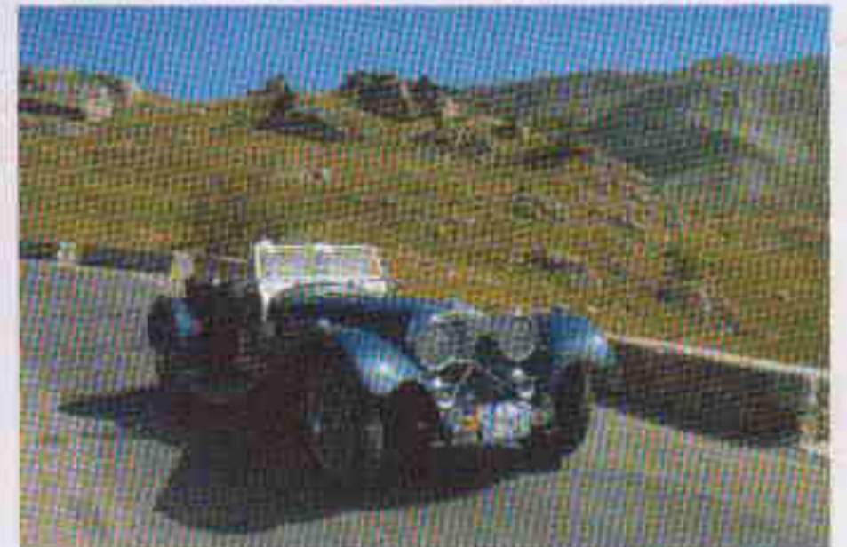
Pour cette sortie, le couple suisse Meyer-Korber avait choisi la Jaguar SS