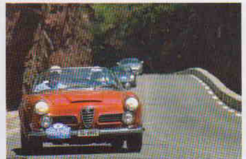
Cette Alfa Romeo 2600 Touring emmène le peloton à travers les gorges.