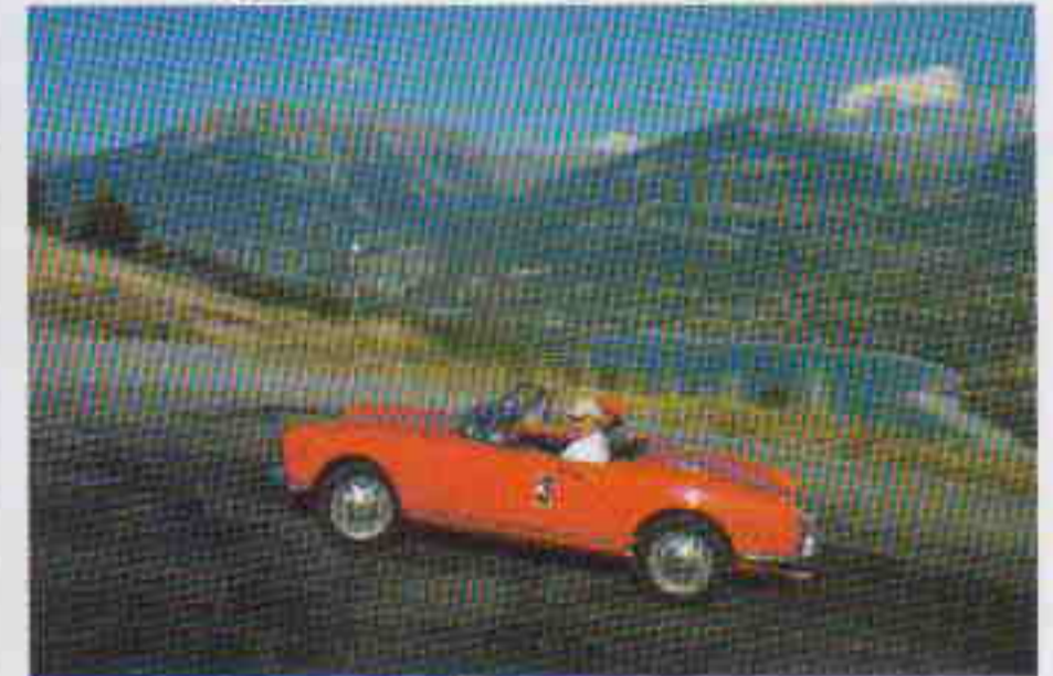
Le soleil revenu, les équipages ont pu profiter des cabriolets