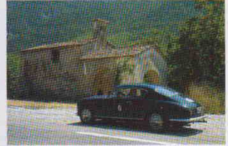
Une très belle Lancia Aurelia B20