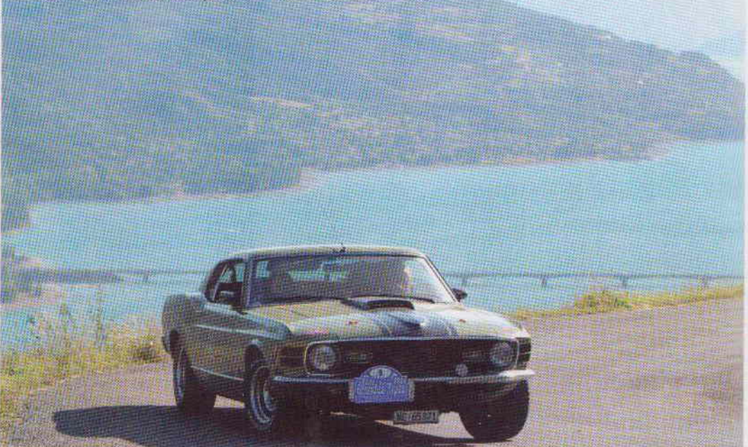
Cette Ford Mustang s'est parfaitement bien adaptée aux étroites routes alpines.

De cette randonnée, les équipages, venus de toute l'Europe, retiendront des paysages à couper le souffle, des étapes confortables, mais aussi et surtout une sélection de routes parmi les plus intéressantes, permettant à la fois de profiter d'un nombre non négligeable de grands cols, avec les panoramas qui vont avec, mais aussi d'éviter les routes importantes, toujours chargées à cette époque par les vacanciers. Cela prouve que la date choisie, qui pouvait poser question, est bonne à condition de bien sélectionner le parcours. Un nombre d'engagés limité a apporté à la randonnée une ambiance et une convivialité que pouvaient attendre des équipages avant tout en vacances, même si c'était aussi pour profiter de leur auto préférée.