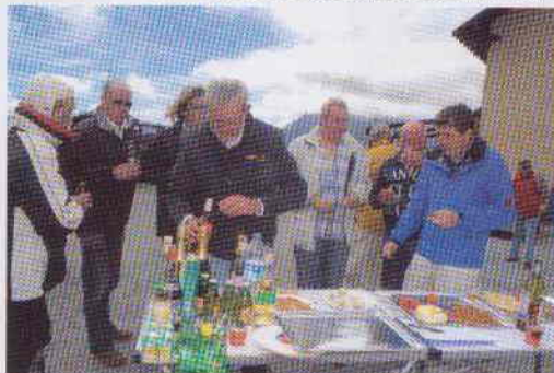
Convivialité avant tout, mais dégustation avec modération