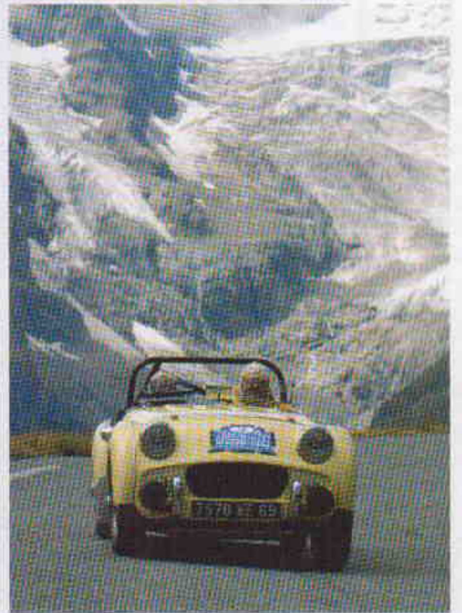
Une Triumph TR3 surgie du glacier